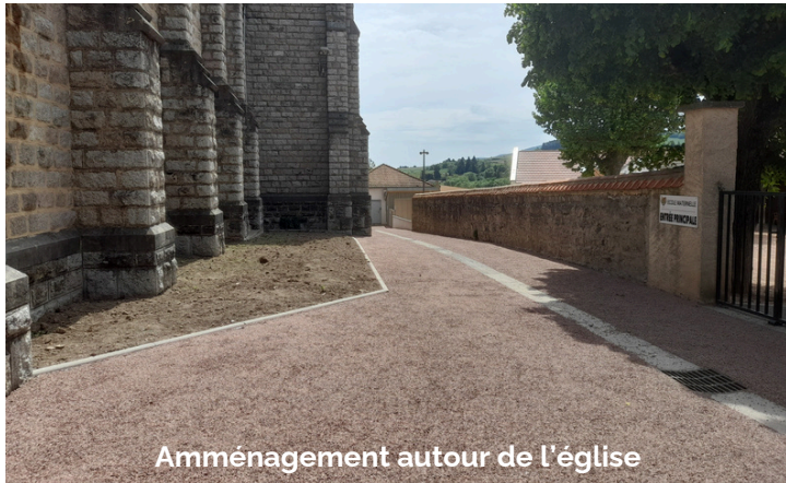
Amménagement autour de l'église