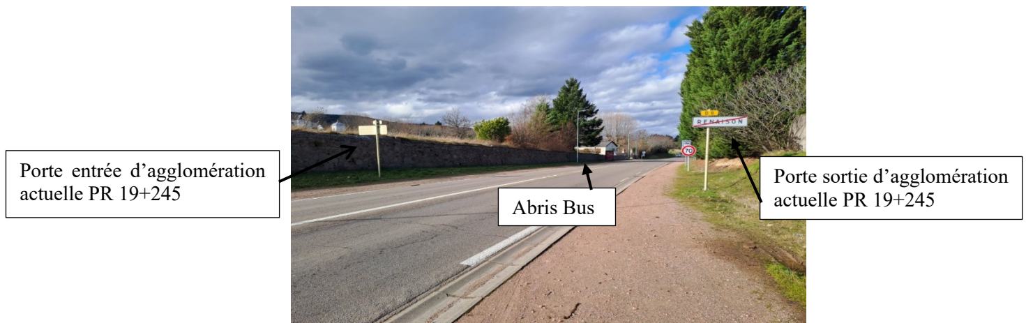
D8 : Plan de situation vers Renaison