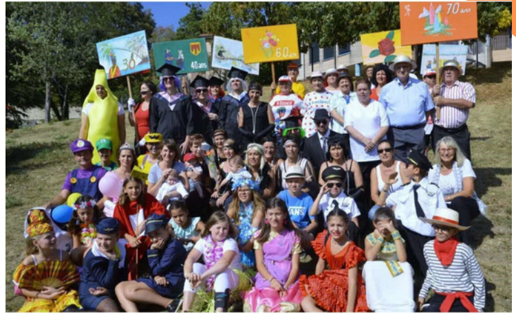
Groupe de 2019